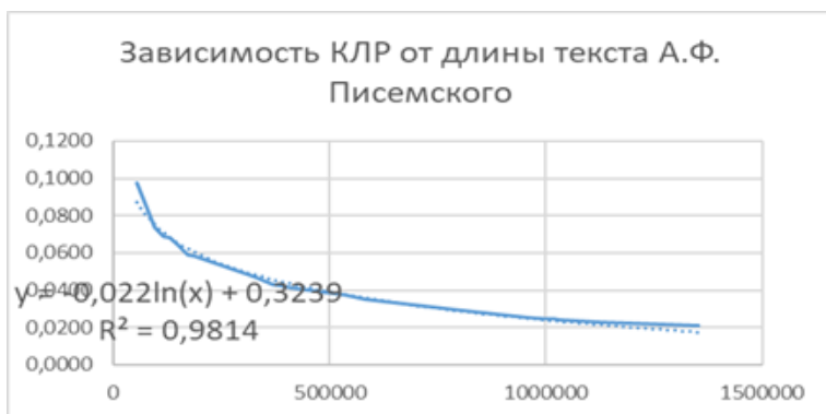
Рис. 1. Динамика КЛР в корпусе художественной прозы А.Ф. Писемского при присоединении к корпусу новых произведений.

В табл. N – текущее значение размера словаря; \Delta N – приращение словаря, то есть количество новых уникальных слов при присоединении очередного текста к метакниге; M – текущее значение размера метакниги; \Delta M – приращение размера метакниги, то есть количество словоупотреблений в присоединяемом к метакниге тексте; Y_{TTR} – текущее значение TTR (КЛР).